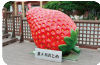
■いちごの里 小山市大川島408

いちごの里の敷地内には、高さ幅がそれぞれ1.5メートルの巨大いちごのオブジェ「#メガおとめ」が飾られていて、映える記念撮影スポットとしてお客さまに人気となっています。