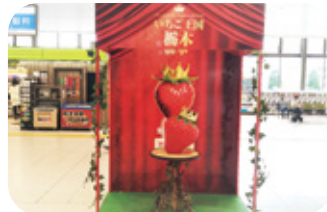
■JR宇都宮駅 宇都宮市川向町1-23