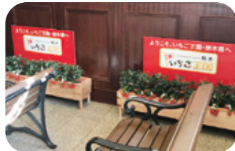
■JR日光駅 日光市相生町115

JR宇都宮駅・JR日光駅の駅構内に設置されたいちごのプランターは、いちごのいい香りで観光客をお出迎えています。また、JR宇都宮駅にはかわいらしいフォトスポットも設置されています。