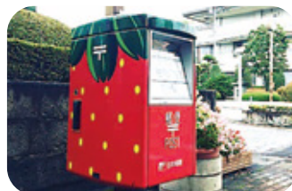
■鹿沼市役所 鹿沼市今宮町1688-1

いちごポストは、鹿沼市役所前にあります。「いちご市」鹿沼には、いちごバス停やいちご電柱、いちごナンバープレートなど、いちごが盛りだくさん。ぜひ探してみてください。