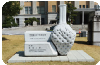
■栃木県庁 宇都宮市埴田1-1-20

栃木県内のいちご生産量が50年連続日本一となったことを記念し、栃木いちご消費宣伝事業委員会から寄贈された記念碑。石像の横に座って写真を撮ることができます。