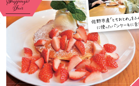
「クア・アイナ」のいちごとメープルのパンケーキ860円(税込)